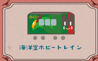
海洋堂ホビートレイン