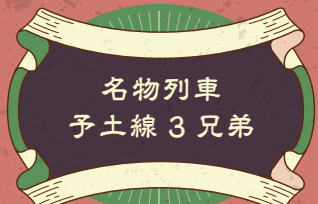
名物列車 予土線3兄弟