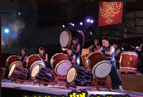
太鼓集団 魁 (鬼北町)