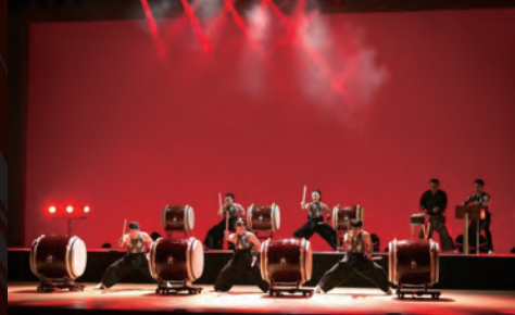
太鼓集団 天邪鬼 (東京都)