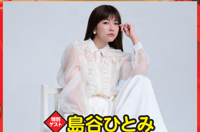
特別ゲスト 島谷ひとみ