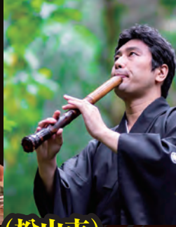
特別ゲスト 徳永ゆうき