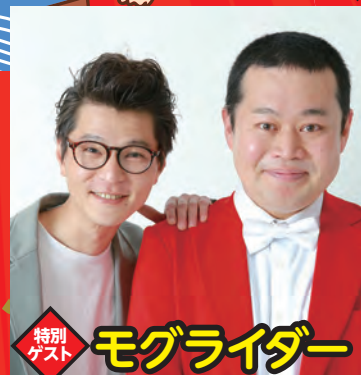
特別ゲスト モグライダー