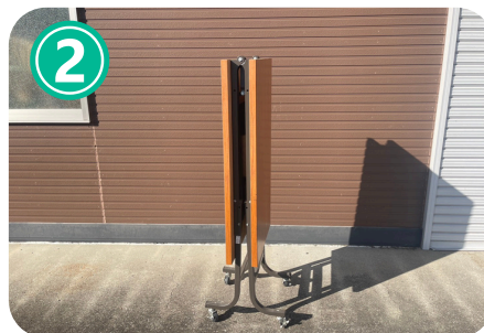
②折り畳み長机（中折式）数量 1本