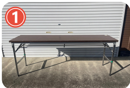
①長机 数量 24本